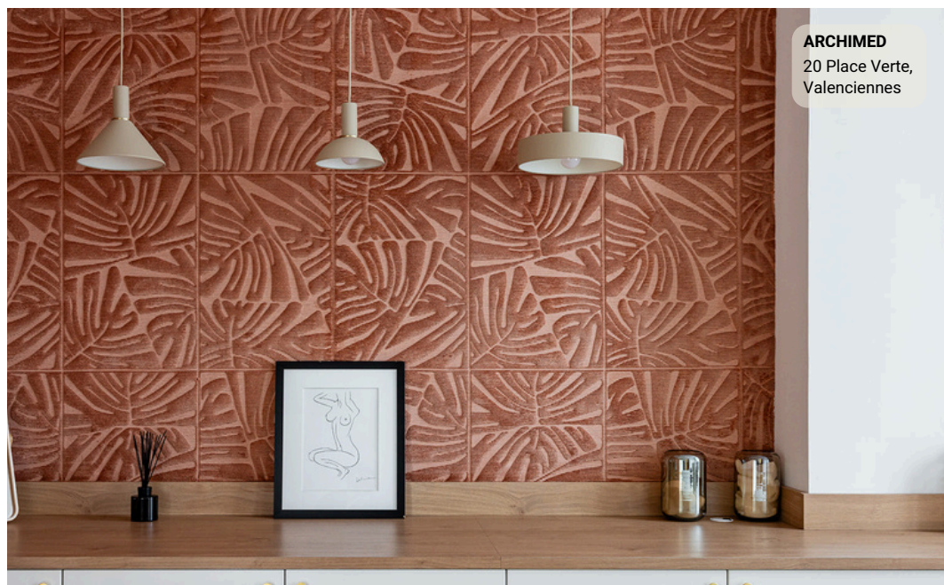
ARCHIMED 20 Place Verte, Valenciennes